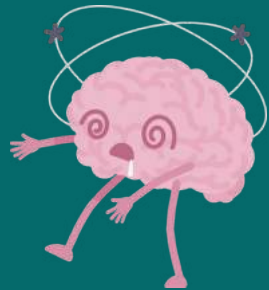
Menghambat Kemampuan Kognitif