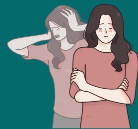
Rasa Cemas Berlebihan