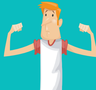
Badan menjadi kurus