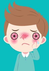
Mata menjadi merah