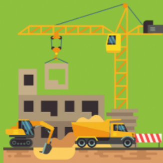
Aktivitas Konstruksi Jalan