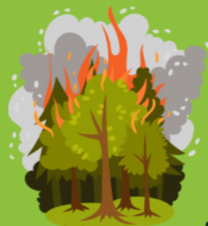
Kebakaran Hutan dan Lahan Terbuka