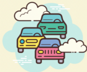
Lalu Lintas Kendaraan